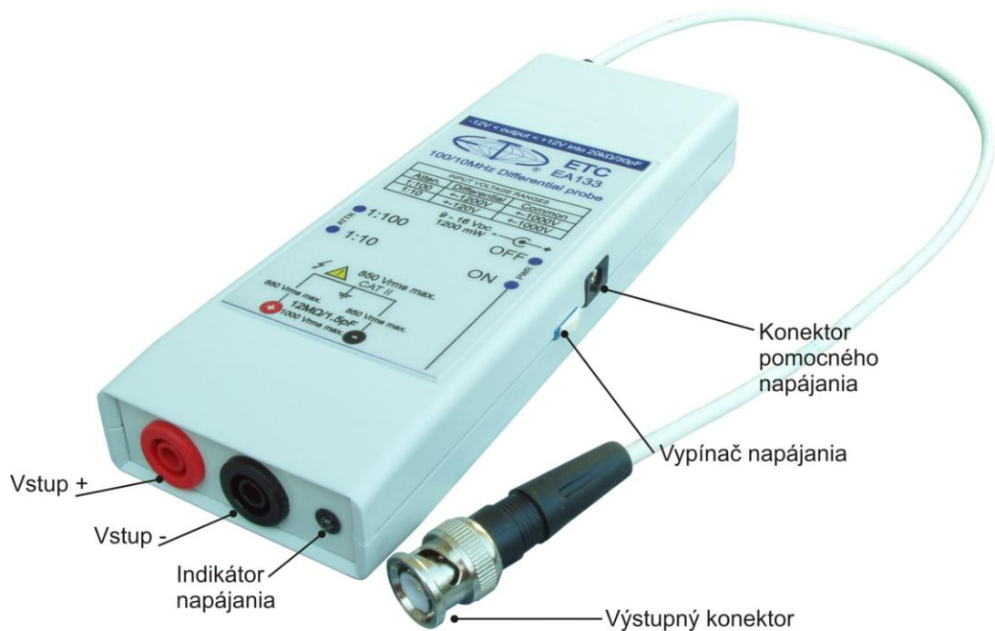
Obr. 1.1. Pripojovacie a ovládacie prvky

Pripojovacie a ovládacie prvky na sonde sú zobrazené na obrázkoch 1.1 a 1.2.