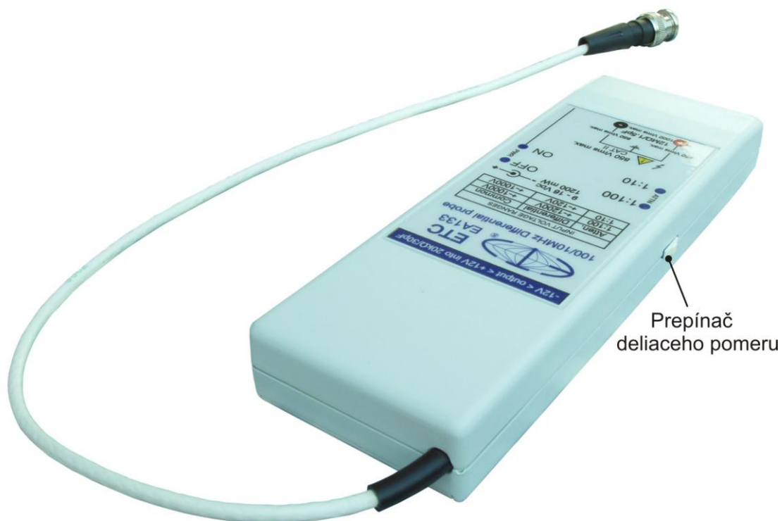
Obr. 1.2. Umiestnenie prepínača deliaceho pomeru